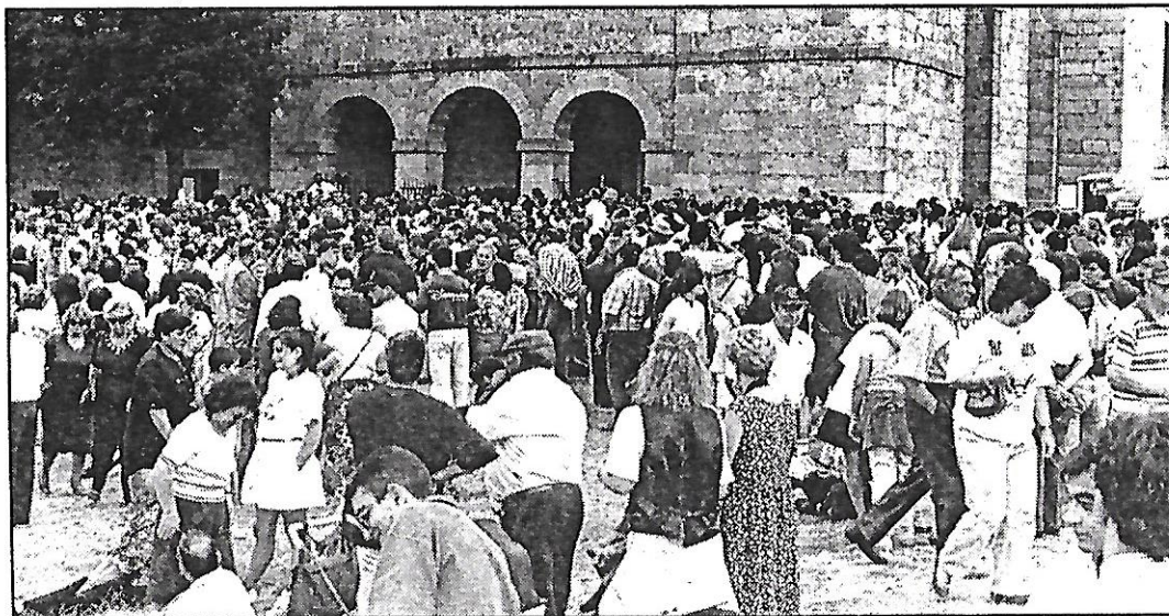
Son cientos los abulenses que acuden todos los años a la Romería.